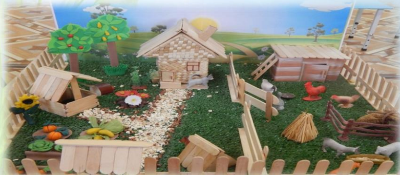
Макет «Домик в деревне»