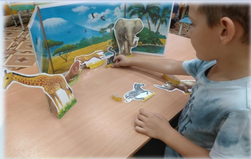
Макет «Животные севера»