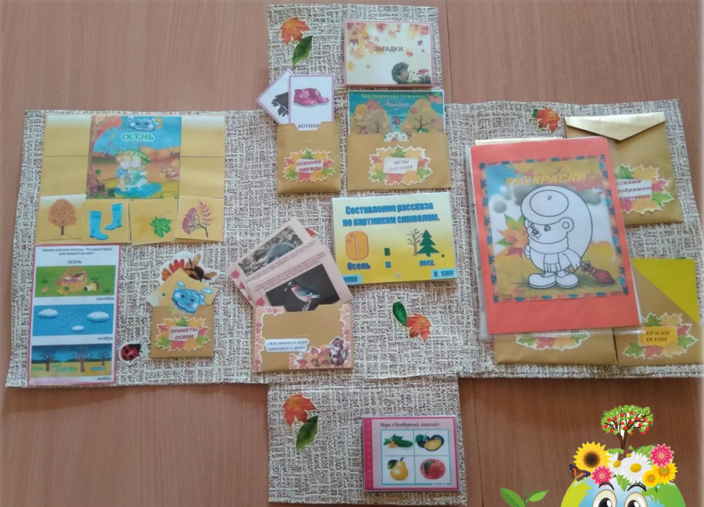
Лэпбук «Золотая осень»