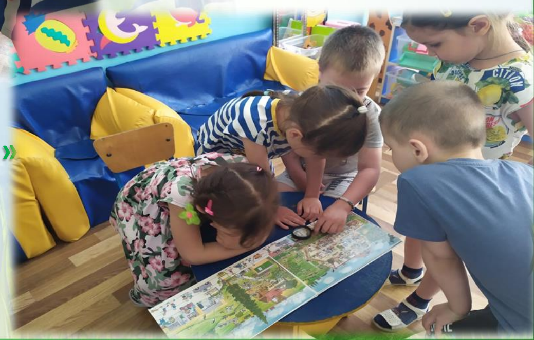
Виммельбух «Овощной магазин»