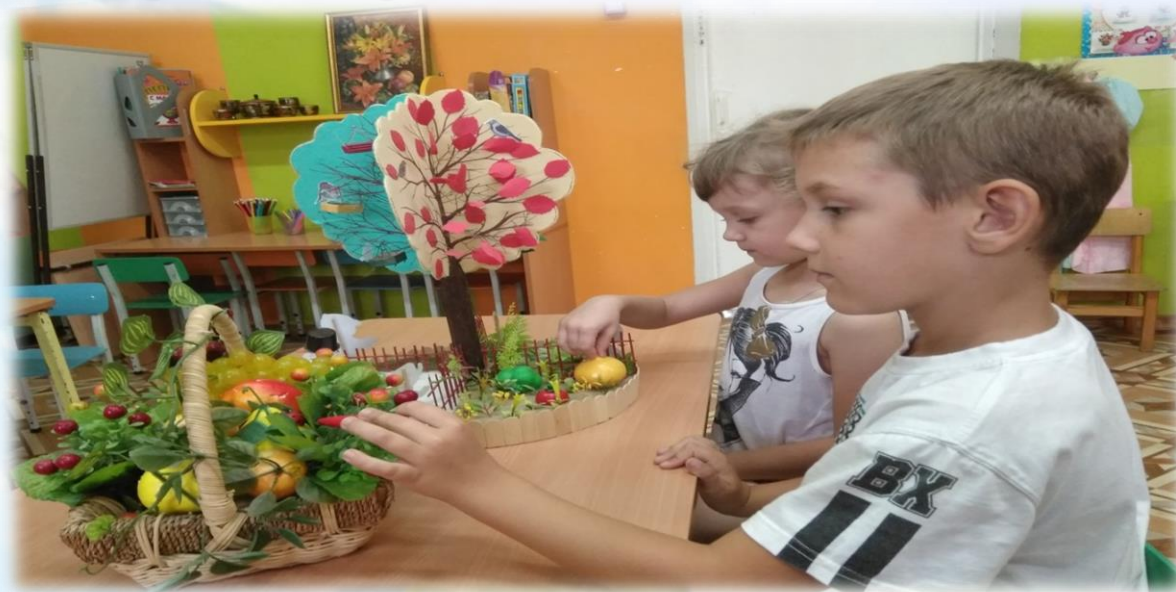
дидактическое дерево «Времена года»