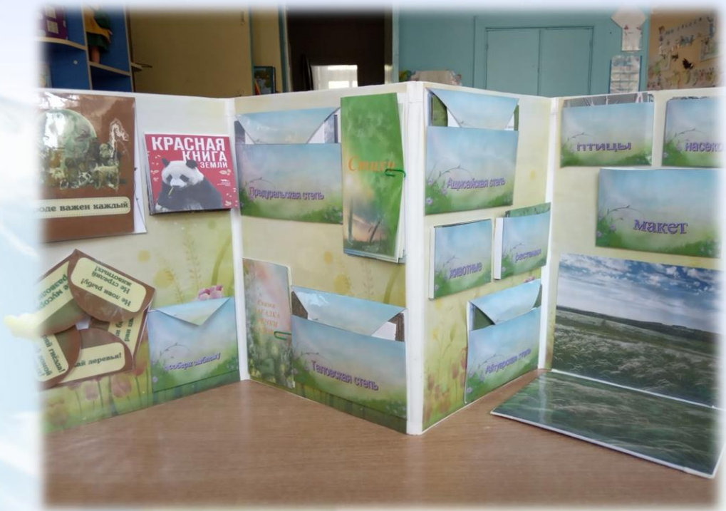
Лэпбук «Природный заповедник «Оренбургский» и «Шатан-Тау»