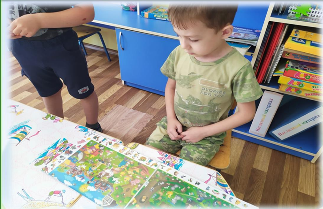
Виммельбух «Морской мир»