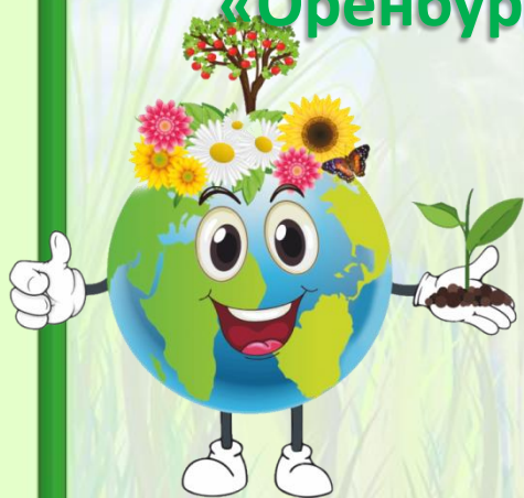
Макет «Оренбургская степь»