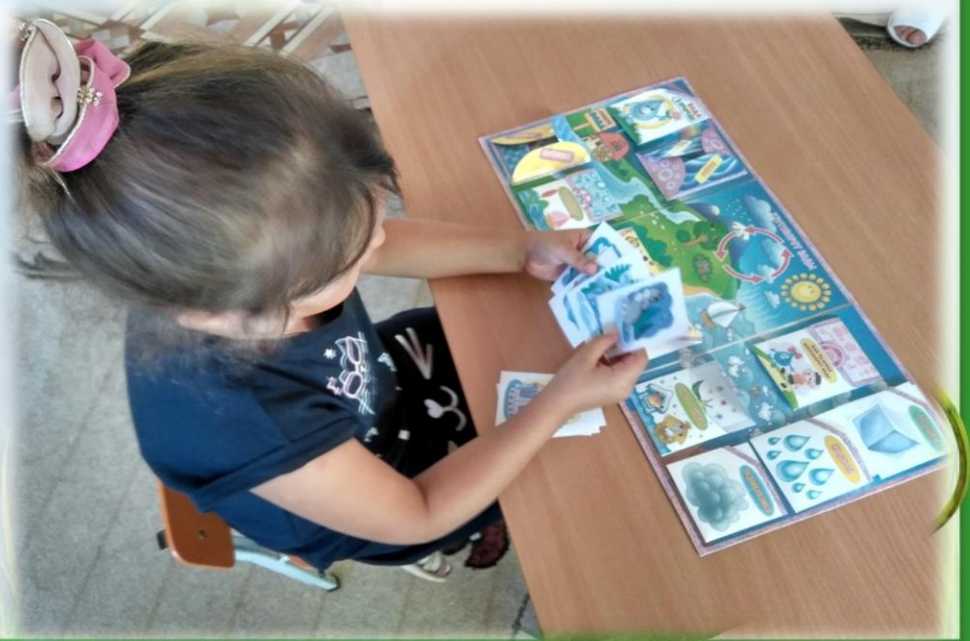
Лэпбук «Наше лето»