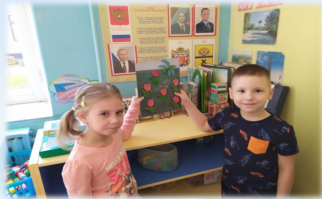
Декоративное панно «Вот оно какое лето»