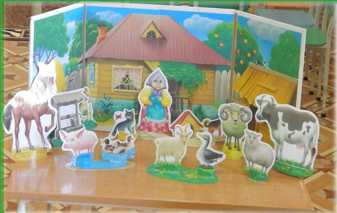
Макет «Домашние животные»